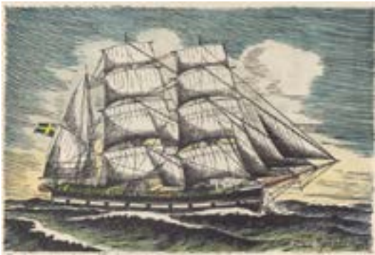
Octavia från Kalmar, teckning av John Sjöstrand

OB , uttytt Ordensbröderna, var ett manligt sällskap av ordenskaraktär som existerade under andra hälften av 1800-talet och som sammanträdde på Hotell Witt.