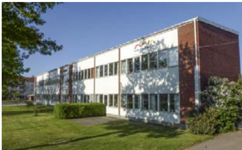
Oxhagsskolan. Numera Karl-Oskar skolan

Strax efter Brömsebrofreden 1645 erhöll han Södra Møre, 8 prästegäll och 11 socknar, som ärftligt grevskap, se ›grevskapet Södermøre, och 1647 inköptes ›Värnanäs av släkten Ulfsparre till grevskapsresidens. Han byggde där en ny huvudbyggnad ›Näset, 1649.