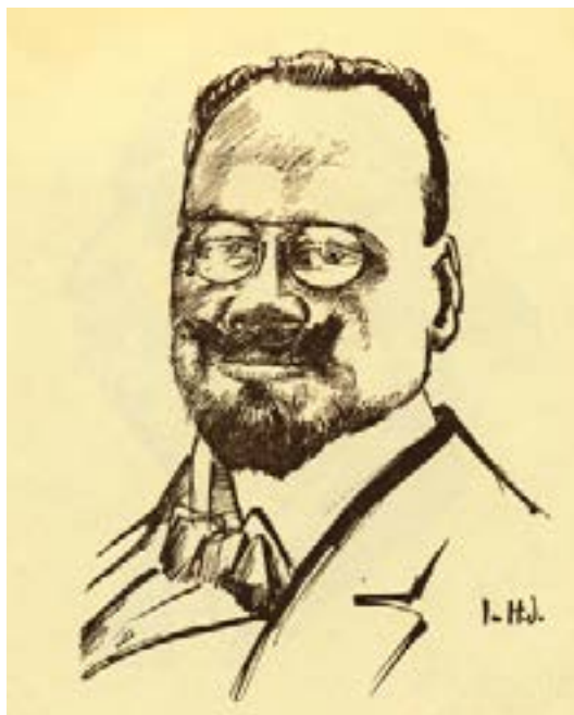
J Fred. Olson Teckning av Ivan Hoflund