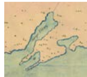
Olsan ligger i förlängningen av Vikingavägen och är nu mindre än på dessa kartor från 1726 resp. 1936