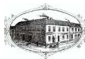
Olsbonska huset. Brevhuvud