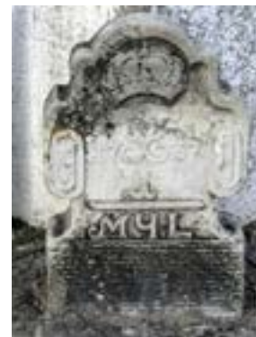
milstolpar. Denna finns vid korsningen Ölandsgratan - Västra Vallgatan

More Biogas Småland AB bildades 2011 efter flera års förberedelser. Bolaget har 22 delägare varav 18 är lantbrukare i Förlösa, Läckeby och Rockneby strax norr om