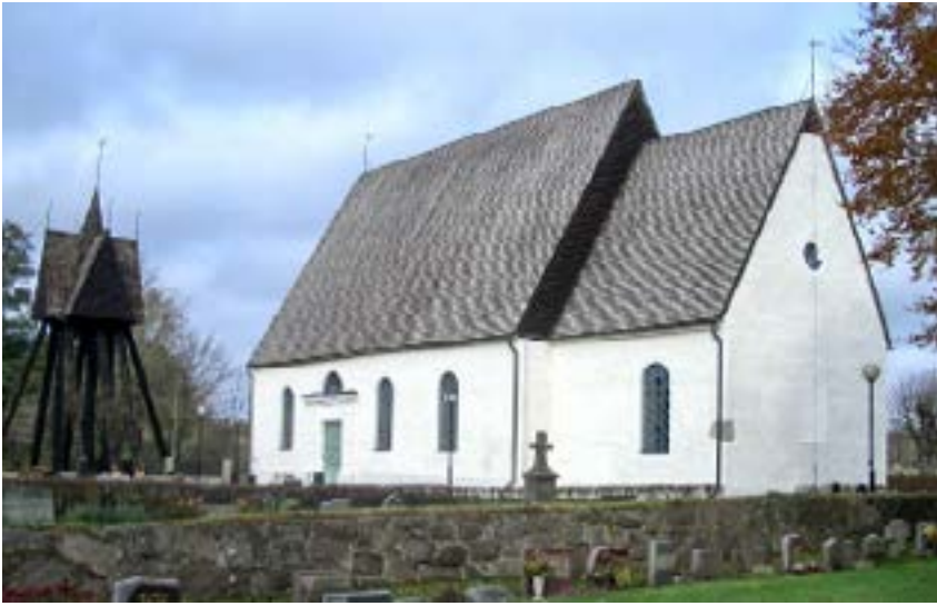
Mortorps kyrka.

väl sammangift med en äldre altartavla. I långhusets östra del finns predikstolen, även den ett fint arbete i rokokostil. I långhusets västra del är det läktarbröstningen med måleri från 1700-talet som dominerar tillsammans med orgelhuset i nyklassicism. Den mot mittgången slutna bänkinredningen som installerades i kyrkan på 1600-talet har en renässanskaraktär med sina arkadbågar och kannelerade pilastrar. Takmåleriet, kopierat från 1800-talets dekorationsmåleri, uppvisar ytterligare ett tidsskikt av kyrkans historia. KLM