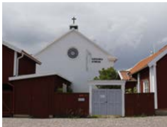
Metodistförsamlingen. S:t Pauls kyrka. Numera katolsk kyrka

den Allsmektige Gudens tjänst och dyrkan i överensstämmelse med Metodistkyrkans trosbekännelse och församlingsordning. På grund av vikande medlemsantal upphörde verksamheten 1986 efter nästan 120 år och byggnaden såldes till ›Katolska församlingen 1987. NJ