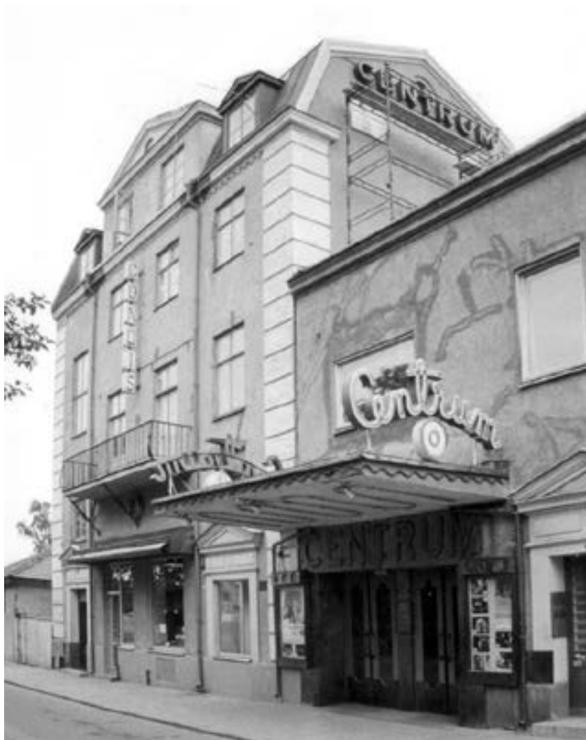
Marmorpalatset. Här låg även biografen Centrum och konditori Atlantic

sar med hästarna uppställda på Storgatan med sina mäktiga baksidor vända mot de gående. Utanför staden tilläts med början 1830–1840 en marknad vid Drags gamla lastageplats och hamn. Evenemanget flyttades 1862 till Rockneby där det fortfarande äger rum varje år. I modern tid har ›Kalmar marknad uppstått.