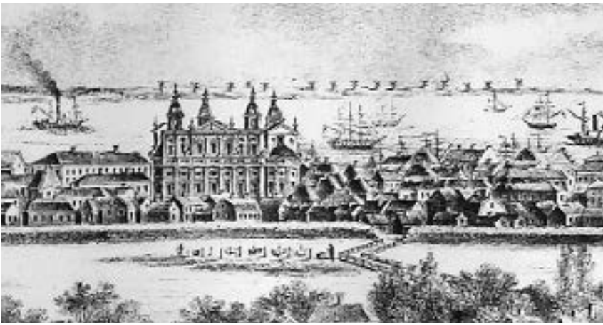
Malmbron. Del av bild från taket på Norrgård ca 1860

Esplanaden och Trädgårdsgatan via cirkulationsplatsen på ›Sveaplan. År 1870 byggdes en körbro av trä som 1925 ersattes av den nuvarande bron. Förbindelsen mellan ›Malmen och Kvarnholmen utgjordes från 1600-talet av en spångliknade gångbro, Malmbryggan, via två holmar mellan Strandgatan och Kaggensgatans norra del. Den kallades även Norra gångbryggan.