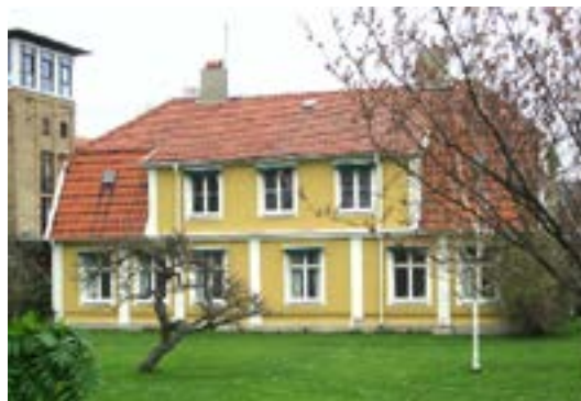
Manilla.

mannablod , eller sommarfläder, latin Sambucus ebulus , är en flerårig 1–1,5 m hög giftig ört med illaluktande blad och blekröda mandeldoftande blommor. M omnämns av Carl von Linné i boken om hans öländska resa 1741 att han hade i uppdrag att utröna vad mannablod mände vara för en växt: om vilken sagan går, att den på ingen annan ort i världen skall finnas mer, än endast vid Kalmar slott, därest hon skolat uppsprungit