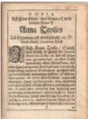
Mornayska stipendiet. Titelsidan av donationsbrevet