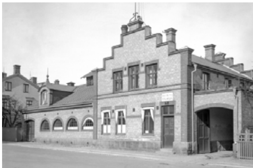
Mejeriet. Smålandsgatan 4

Messenius, Arnold Johan , 1607–1651, rikshistoriograf, född i Danzig. Han utarbe-