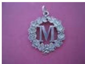
MG Sällskapet. Från en ordensprydnad.