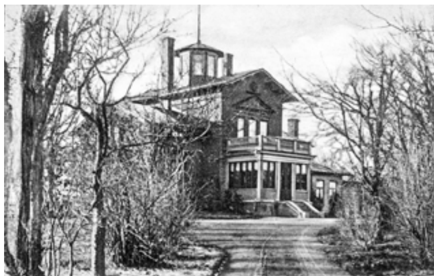
Monte Cavallo. Ursprungligt utseende med lanternin