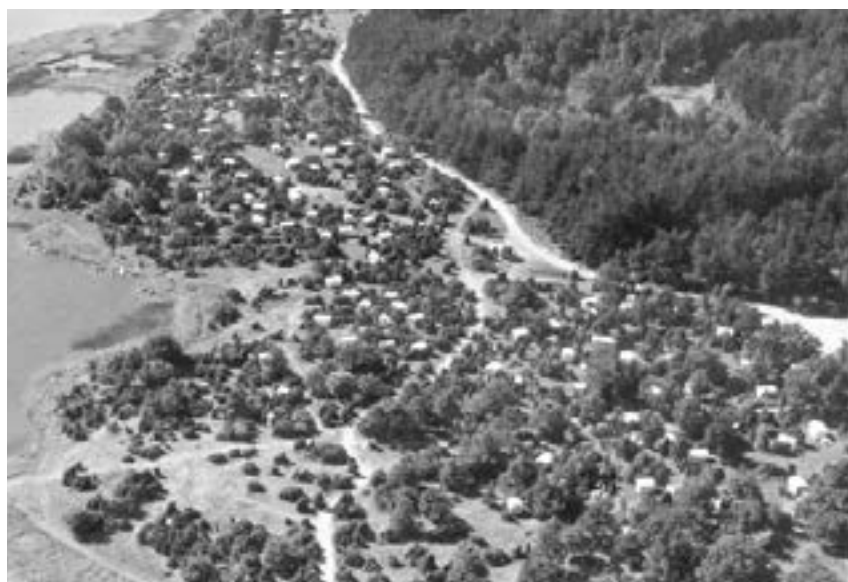
Masonitstugor. Stensö 1951

Mejeriet , idag Arla Foods AB, byggdes 1954 på Daléngatan 8 och ersatte det tidigare på Smålandsgatan 4. Det har byggts ut i olika omgångar och producerar numera endast Grevé-, Herrgårds-, Präst- och Sveciaost samt en lagrad lyxost för export under varumärket House of Costello.