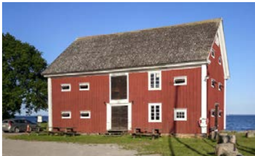
Mortorps sockenmagasin. Nu i Ekenäs.