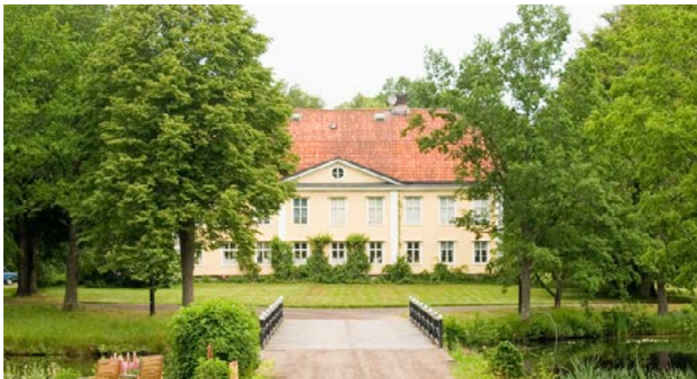
Christinelund.