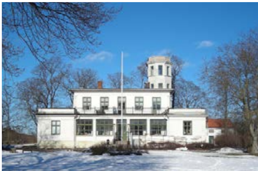
Carlsberg. Stagnelisgatan 12