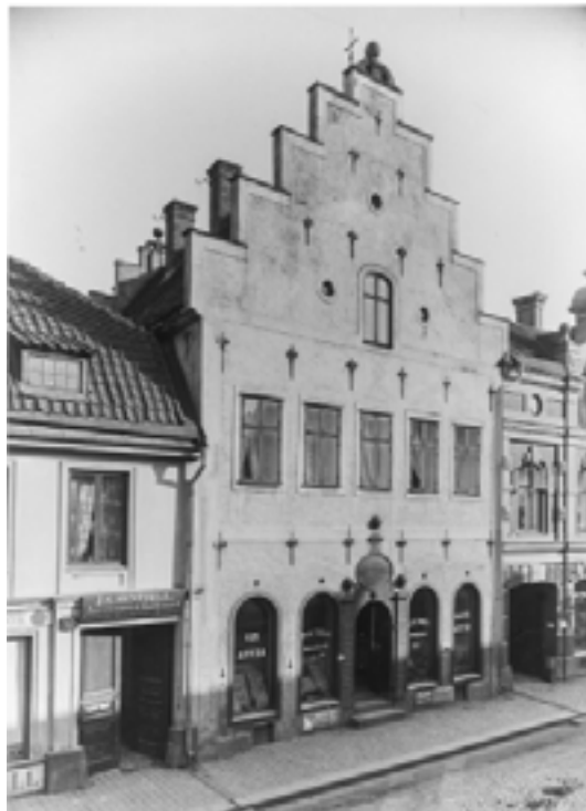
Castenska gården.