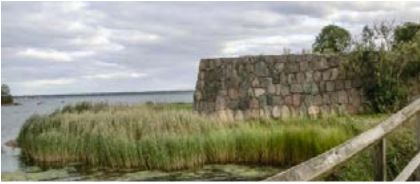
Carolus Philippus Dux.

krönta med stenklot. På bottenvåningen låg verkstad och handelsbod, på övervåningen bodde man. Magasin fanns i källaren och på vinden. Inne på gården låg stall och vagnskjul. Fortfarande bedrivs handel i fastigheten. Mer att läsa Manne Hofrén, Kalmar, karolinska borgarhus i sten , 1970.