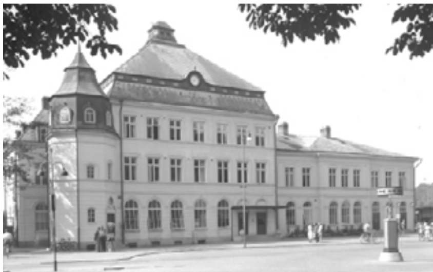
Centralstationen före högertrafiken